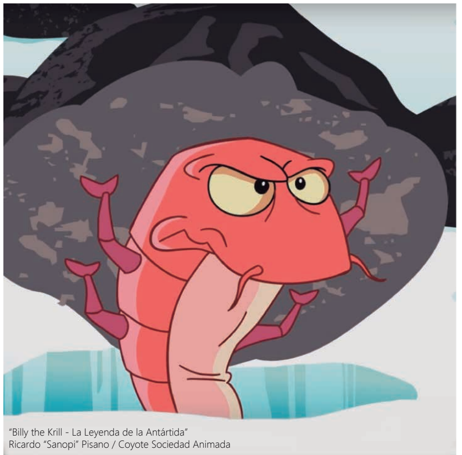
"Billy the Krill - La Leyenda de la Antártida" Ricardo "Sanopi" Pisano / Coyote Sociedad Animada